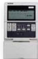
Trådbunden kontroll WC-M medföljer